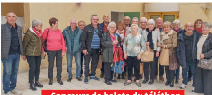
Concours de belote du téléthon

Le Téléthon est organisé par le comité des fêtes et la municipalité. Le marché de Noël avec ses exposants, les activités proposées par les associations et des donateurs individuels ont permis de récolter 2 700€. Bravo à tous pour votre engagement et merci aux nombreux donateurs.