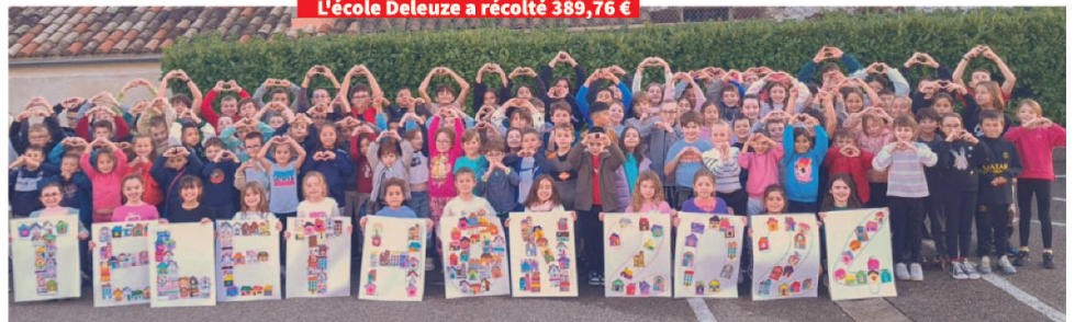
L'école Deleuze a récolté 389,76 €