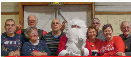
L'équipe du comité des fêtes au marché de Noël