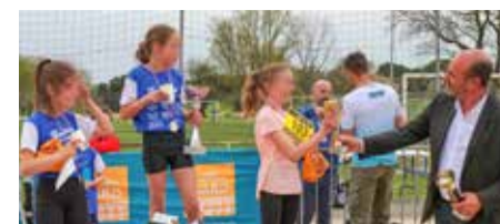
Le podium de la course enfant