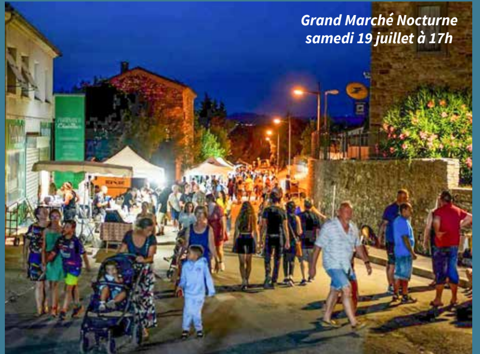
Grand Marché Nocturne samedi 19 juillet à 17h