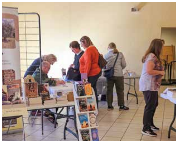
4 e SALON DU LIVRE "Saint'Hilvre"