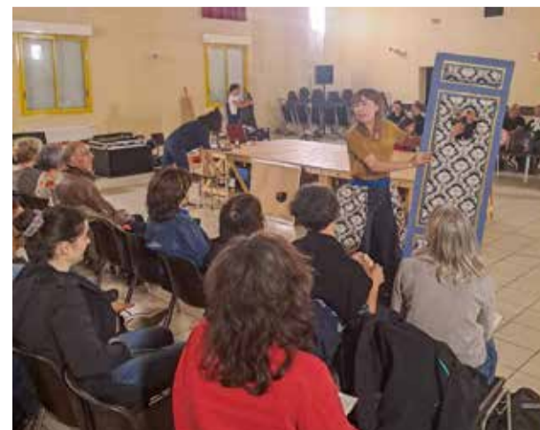
Spectacle du Cratère, "La Saga de Molière"