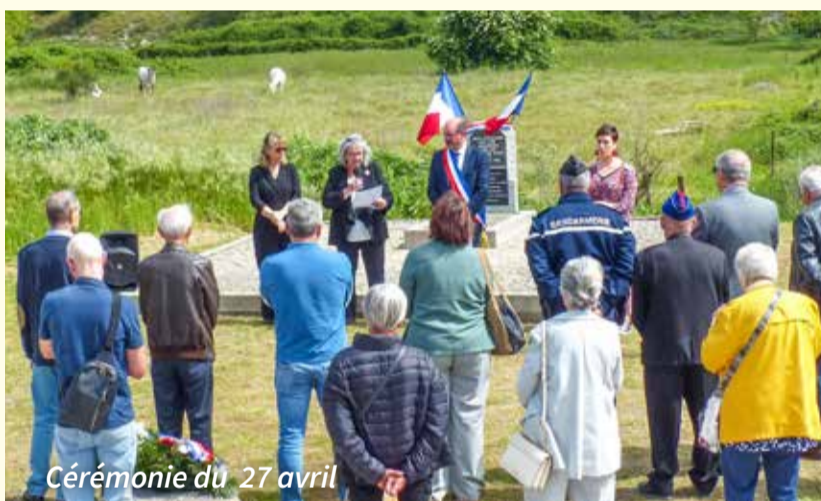
Cérémonie du 27 avril