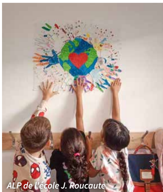
ALP de l'école J. Roucaute

Ces interventions traduisent la volonté communale d'investir durablement dans la qualité, la sécurité et le bien-être au sein des écoles.