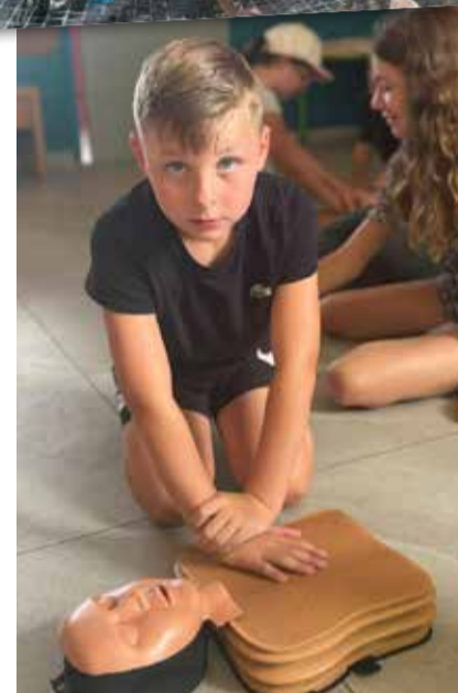
Initiation aux gestes de premiers secours avec l'association prévention action sport et secourisme.