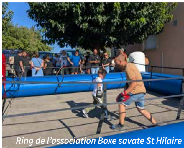
Ring de l'association Boxe savate St Hilaire