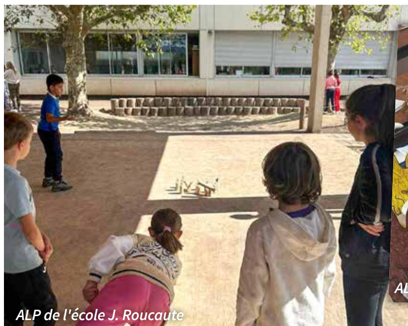
ALP de l'école J. Roucaute