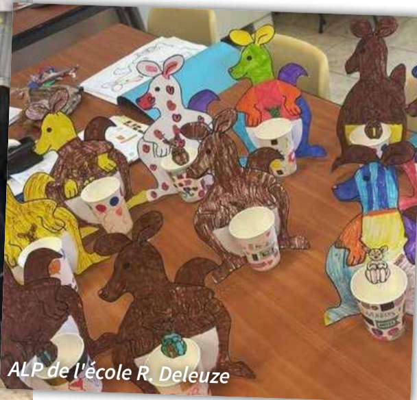
ALP de l'école R. Deleuze