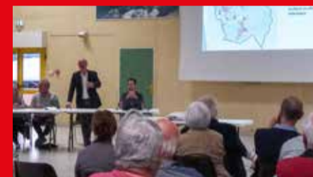
Réunion publique de présentation du PADD

La commune poursuit la construction de son Plan Local d'Urbanisme (PLU), document essentiel qui fixe les orientations d'aménagement et de développement du territoire.