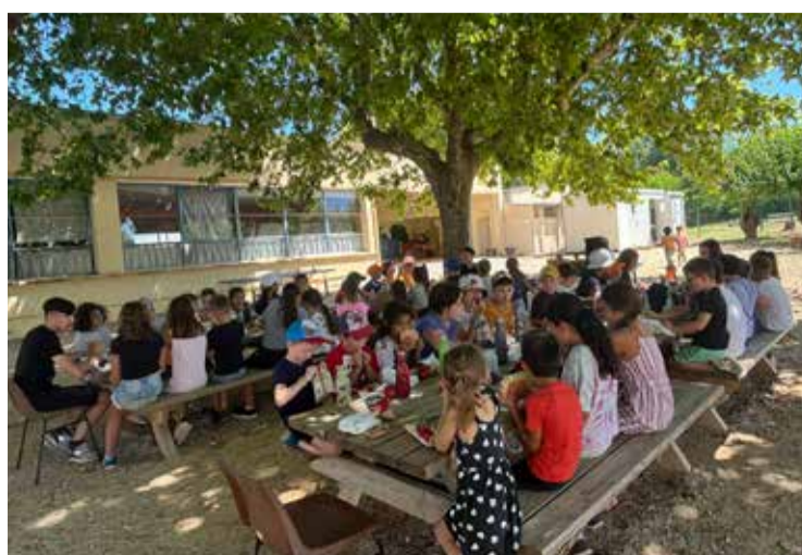
Repas en extérieur aux Cocci'Malins