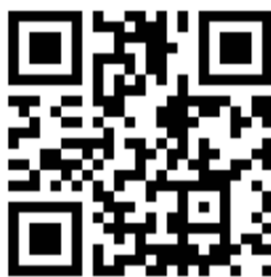
QR-code du site www.shb-rando.fr

Le site www.shb-rando.fr est déjà en ligne, et l'inauguration officielle des sentiers et parcours sportifs est prévue pour janvier 2026.