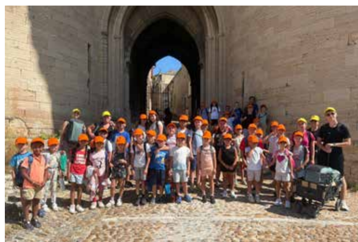
Visite du Fort Saint André à Villeneuve les Avignon à l'occasion des journées du patrimoine