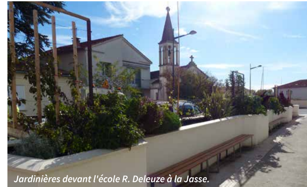
Jardinières devant l'école R. Deleuze à la Jasse.

Une immense jardinière devant l'école René Deleuze. Des potagers urbains en libre-service pour la population : tomates, raisin, artichauts, etc.