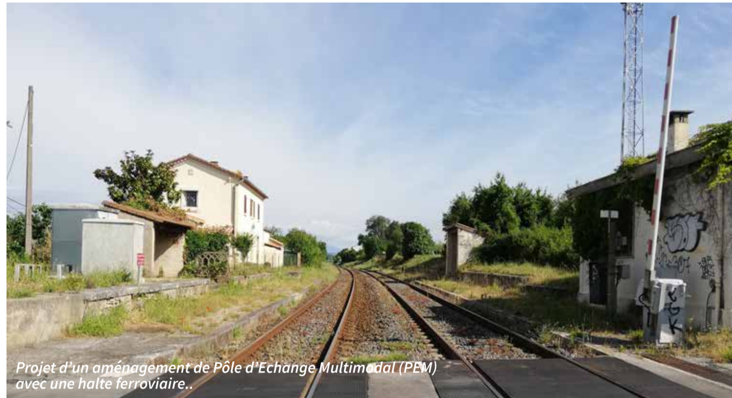
Projet d'un aménagement de Pôle d'Echange Multimodal (PEM) avec une halte ferroviaire.

► Encourager l'intermodalité pour permettre aux habitants de combiner plusieurs modes de déplacements (vélo+train, trottinette+bus) et rendre l'offre de transports en commun plus attractive. De Boucoiran aux