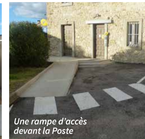
Une rampe d'accès devant la Poste