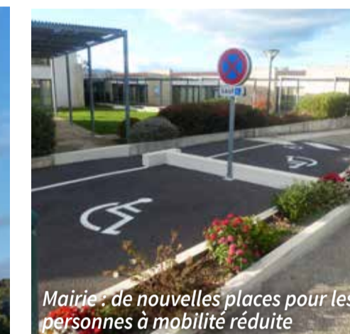
Mairie : de nouvelles places pour les personnes à mobilité réduite