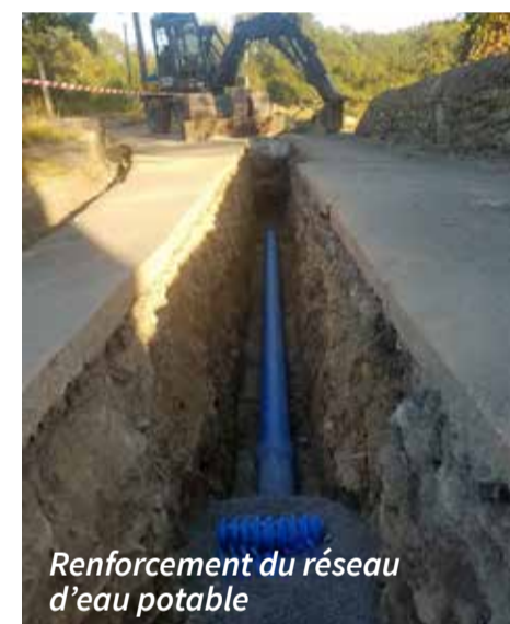
Renforcement du réseau d'eau potable

Une immense jardinière devant l'école René Deleuze. Des potagers urbains en libre-service pour la population : tomates, raisin, artichauts, etc.