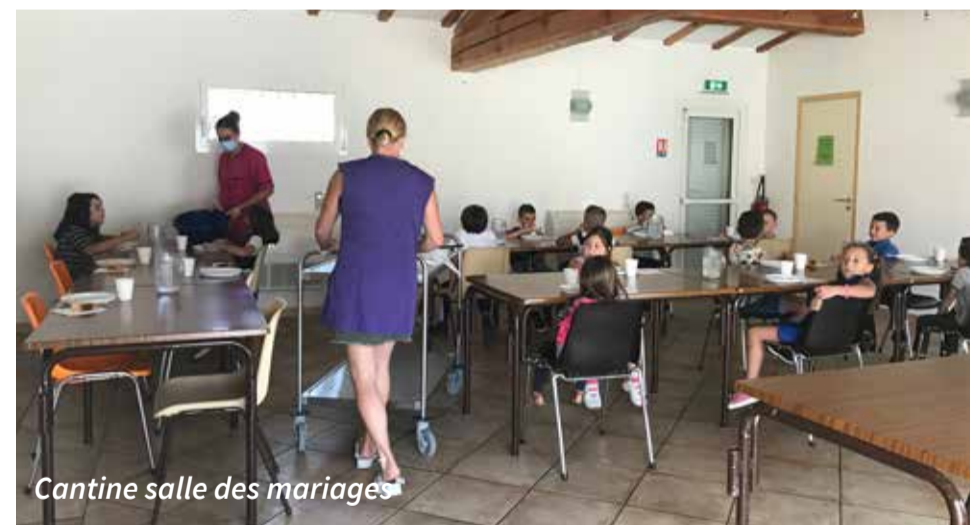
Cantine salle des mariages