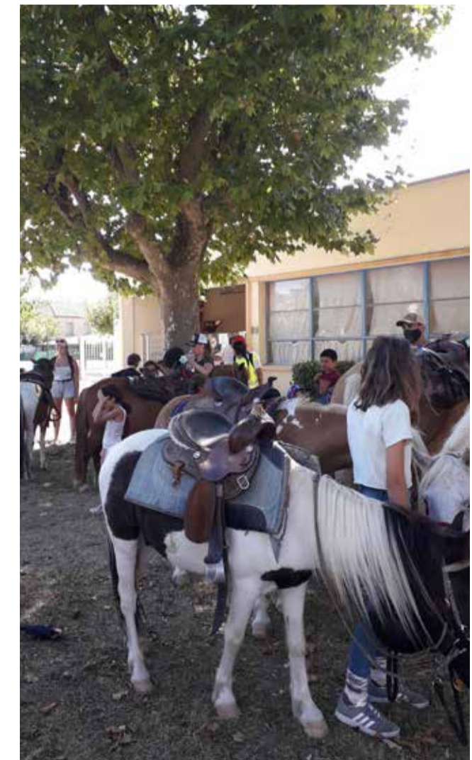
Ce que les enfants ont aussi apprécié, ce sont les fameuses balades à poneys en partenariat avec le centre équestre New Way.