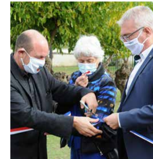
Le ruban est coupé par M.le maire, le city stade est officiellement inauguré.