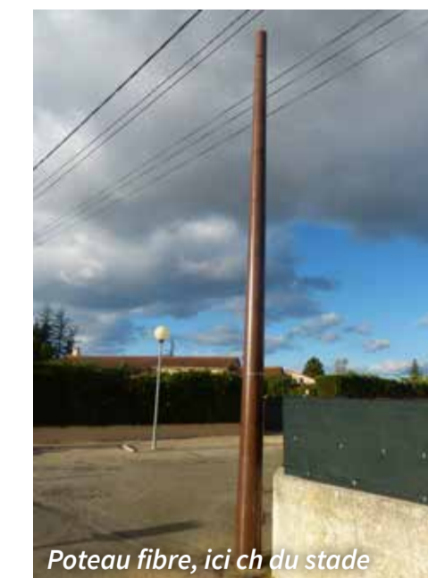
Poteau fibre, ici ch du stade

Au mois de juin, près de 40 lanternes LED ont été placées en remplacement des lampes à phosphore peu éclairantes et très