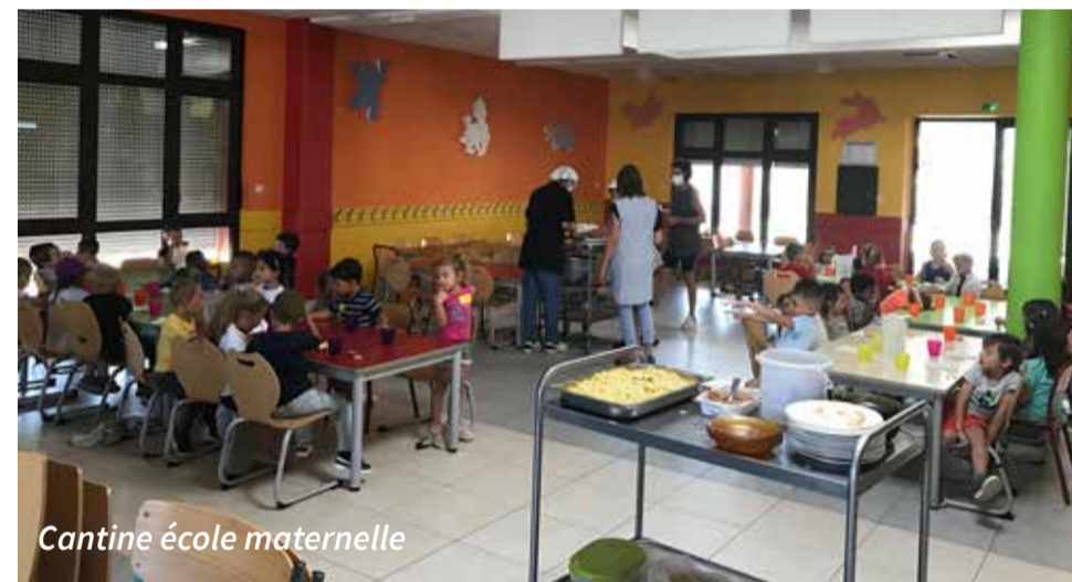
Cantine école maternelle

L'autre effet bénéfique a été d'éliminer définitivement les trajets en bus entre les écoles élémentaires et la cantine du Mas Bruguié entraînant de nombreux effets bénéfiques : moins de risques sanitaires puisque les élèves restent dans chaque école, davantage de temps pour manger et pour se reposer durant le temps méridien, une diminution des émissions de CO 2 et 60 000€ d'économies de bus par an pour la collectivité.