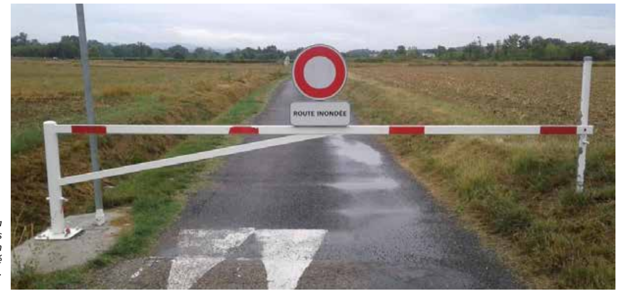
Nous renforçons la sécurisation des voies inondables par l'installation de 3 barrières de sécurité supplémentaires.

► Depuis 2018, nous mettons à votre disposition le Document d'Information Communal sur les Risques Majeurs (DICRIM) dans lequel sont répertoriés les types de risques et les consignes de sécurité.