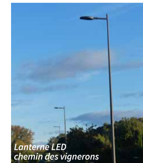
Lanterne LED chemin des vigneron