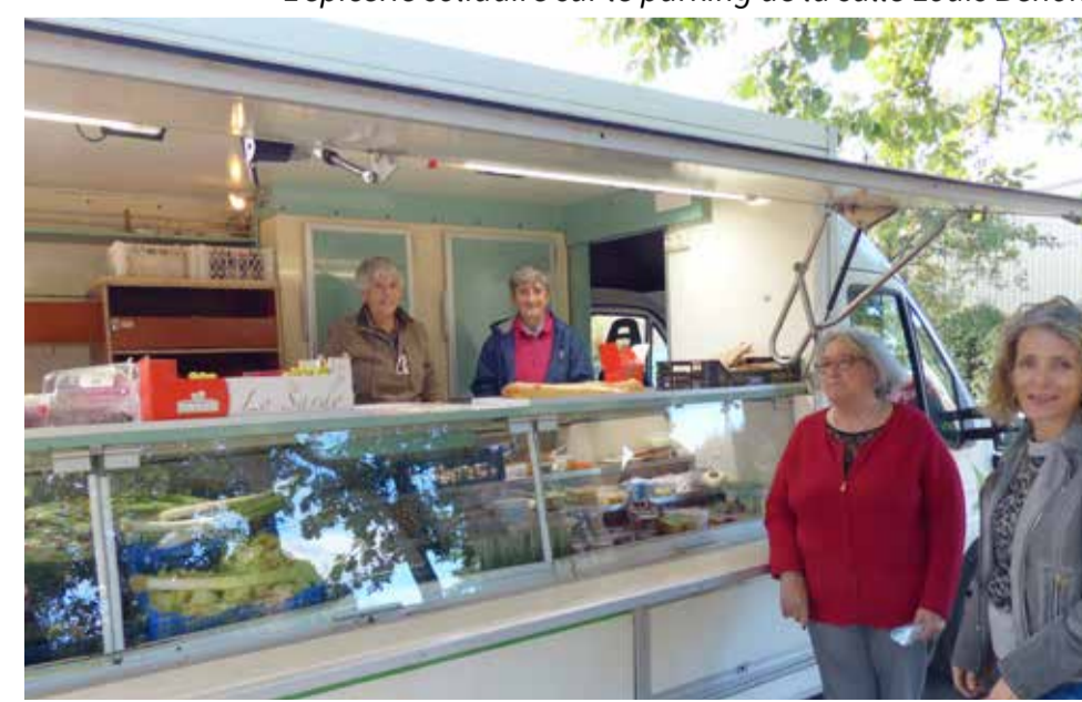
L'épicerie solidaire sur le parking de la salle Louis Benoit.

La situation sanitaire a contraint le CCAS à annuler la semaine bleue et l'après-midi de Noël pour les seniors. Mais, pour terminer sur une note optimiste, la distribution des colis de Noël pour les seniors de 80 ans et + aura bien lieu elle se fera du 5 au 14 décembre 2020.