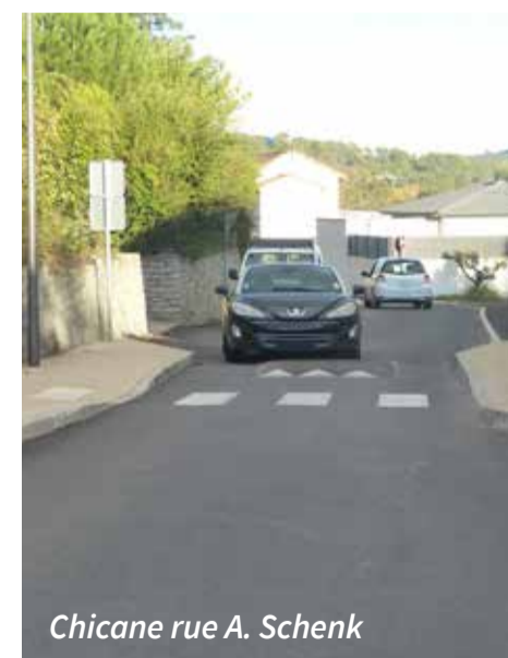
Chicane rue A. Schenk

Travaux de renforcement du réseau d'eau potable en cours sur le chemin des Vignerons avec des conduites en fonte plus larges.