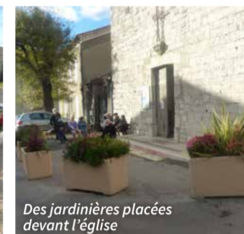
Des jardinières placées devant l'église