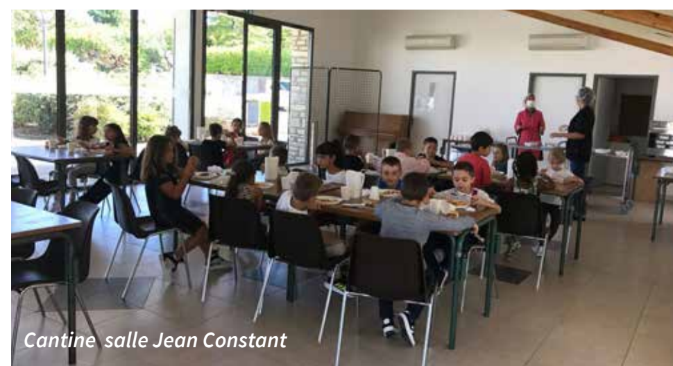
Cantine salle Jean Constant