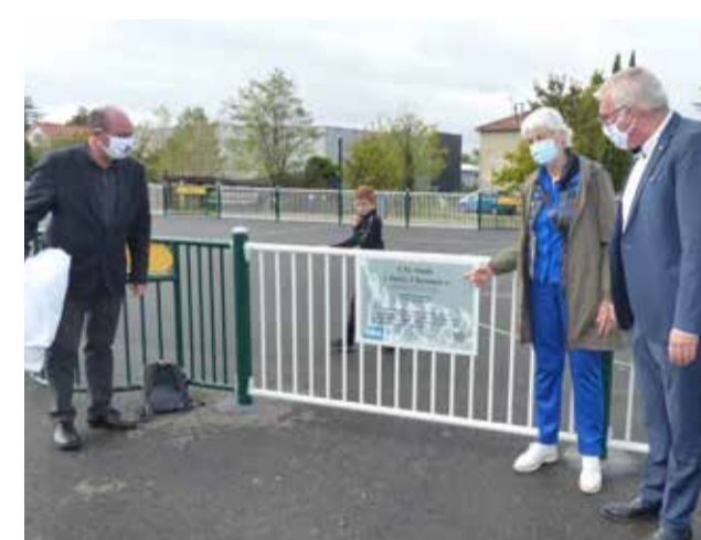
La plaque est dévoilée en présence du président de l'Agglo d'Alès qui a apporté son aide à hauteur de 40% pour la construction de cet équipement.