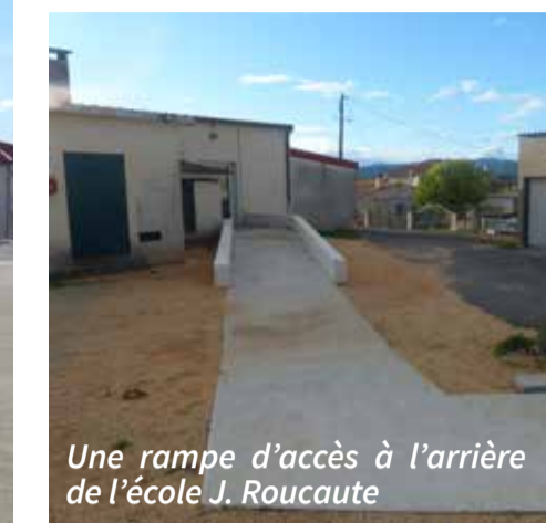
Une rampe d'accès à l'arrière de l'école J. Roucaute