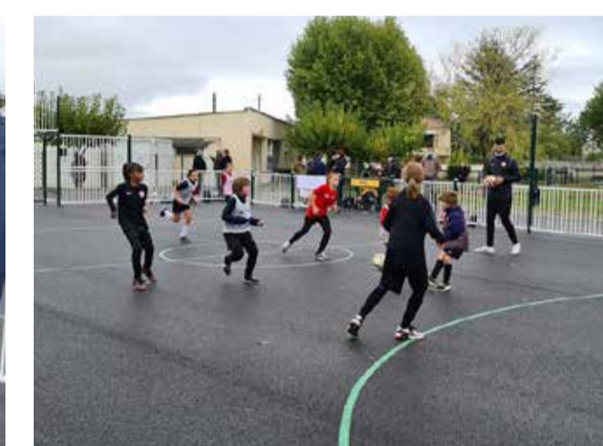
Une démonstration proposée par les enfants du club de foot. La pratique du basket-ball, du handball, du volley-ball et de l'athlétisme est également possible avec cet équipement.