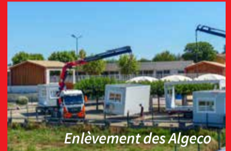
Enlèvement des Algeco