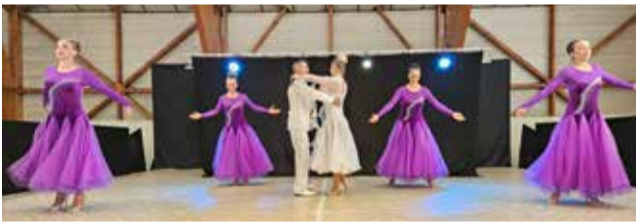
Frenchy Spectacle en action

Le repas a réuni 300 convives cette année. Marcel traiteur a préparé et servi le repas. Le groupe «Frenchy spectacle» a animé cette après-midi du 2 juin 2024.