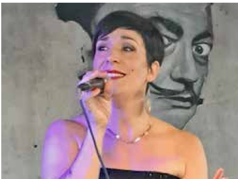
Madame M en concert.

• Concert de Madame M : compositions et reprises de Jazz, de Soul et de chansons françaises samedi 16 novembre à 20h30 , salle Louis Benoit. Entrée libre.