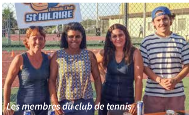
Les membres du club de tennis