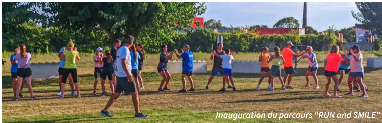
Inauguration du parcours "RUN and SMILE"

Des animations nombreuses lors de la fête des associations avec par exemple le Saint Hilaire Multi Boxes qui proposait des démonstrations et des séances d'essai. Un mur d'escalade a aussi été mis à disposition pour la 2 ème année d'affilée.