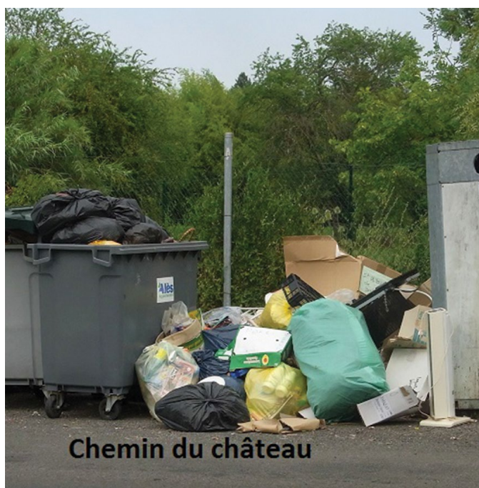
Chemin du château