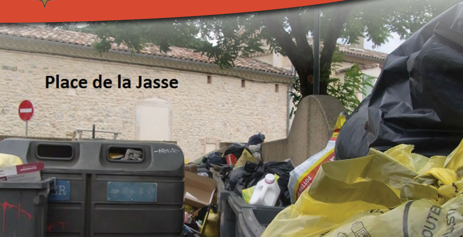
Place de la Jasse

Certains d'entre vous, ont trouvé une étiquette collée sur leur poubelle individuelle indiquant que le service Ordures Ménagères d'Alès Agglomération n'assurerait plus le ramassage de leur poubelle individuelle. Comme il ne s'agissait pas d'un gag douteux, la menace a été immédiatement suivie d'effets. Rappelons, une fois de plus, que la collecte et le traitement des ordures ménagères sont des compétences de l'Agglomération pour lesquelles est acquittée une taxe spécifique relativement élevée.